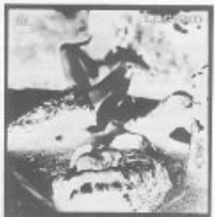
LEGEND Dart 50L 115 • 1969